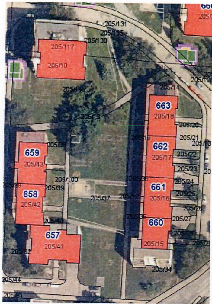
Pískoviště a venkovní hrací plocha u bytového domu č. p. 665