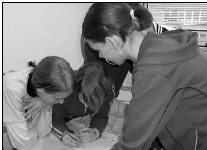
▲ Den Země