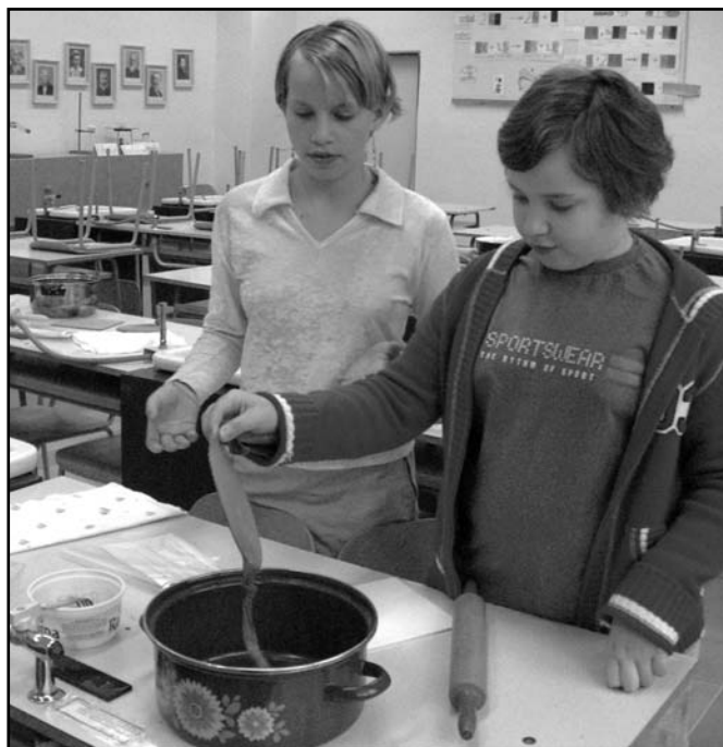
▲ Den Země