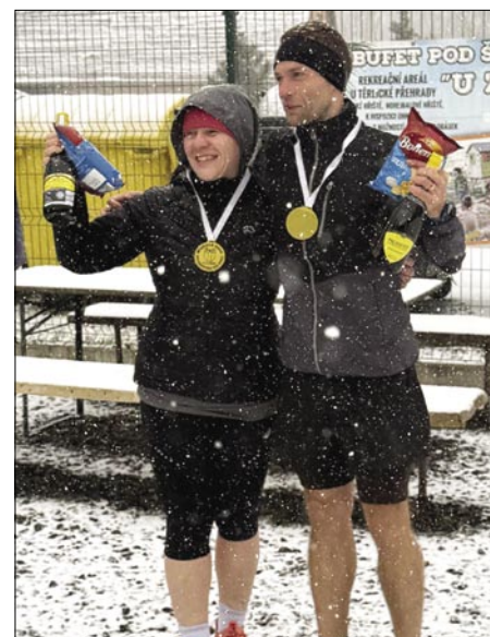
Běžci z Albrechtic s cenami.

ho revíru 2025“. Jedná se o seriál běžeckých závodů pořádaných na území okresu Karviná. Závody jsou určeny pro širokou veřejnost – zúčastnit se může každý. Termíny jsou rozprostřeny do celého roku a délka jednotlivých běhů se pohybuje většinou od pěti do deseti kilometrů. Bližší informace, termíny, vzdálenosti i místa konání jsou k dispozici na internetových stránkách https://blog.skfuga.cz v článku „H10 Běžecký pohár karvinského revíru 2025“.