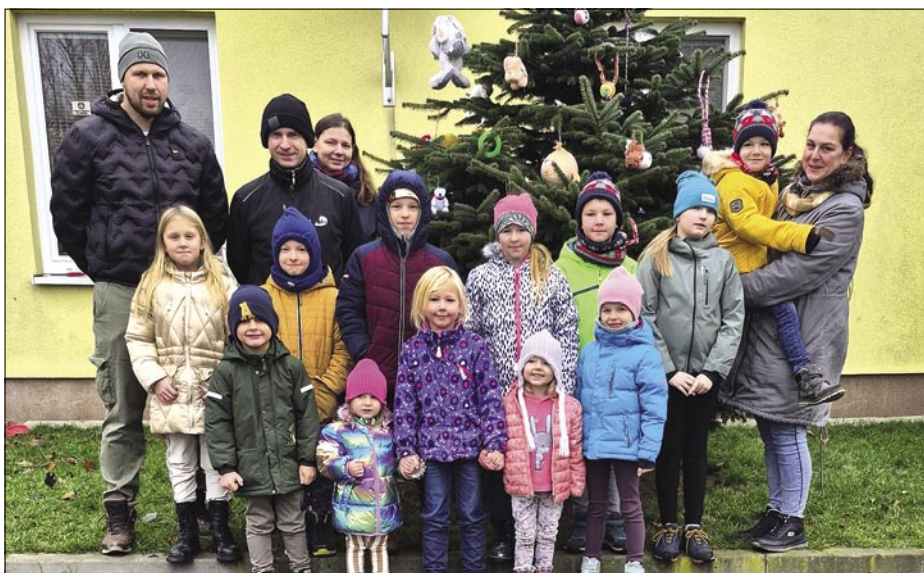
Zbiórka karmy dla zwierząt.

nych psów i kotów nie jest nam obojętne, zwłaszcza zimą, gdy potrzebują one szczególnej troski i wsparcia.