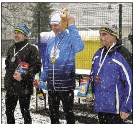
Muži nad 45 let.

Vzhledem k tomu, že během podzimních povodní došlo ke stržení lávky přes řeku Chotěbuzku mezi částí Paseky a Pardubice, museli jsme pro letošní rok upravit trasu běhu. Využili jsme k tomu ulici Strmou za hřištěm, kterou jsme závodníkům dopřáli hned 2x. Poprvé hned po startu závodu a podruhé si ji mohli vychutnat těsně před cílem. Tímto byla zachována délka i náročnost trati obdobně, jako v předchozích ročnících.